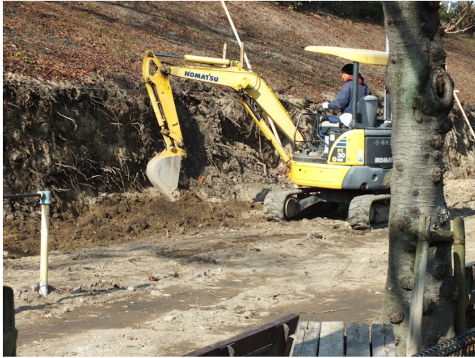
⑦南武ポンプ場付近でドレーン工法工事が始まる。