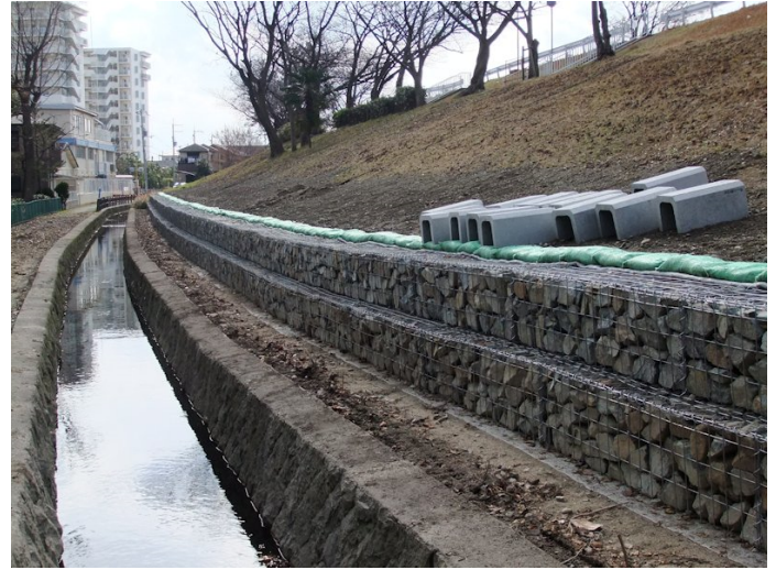
⑧ほぼ完成した武庫元町のドレーン工事。