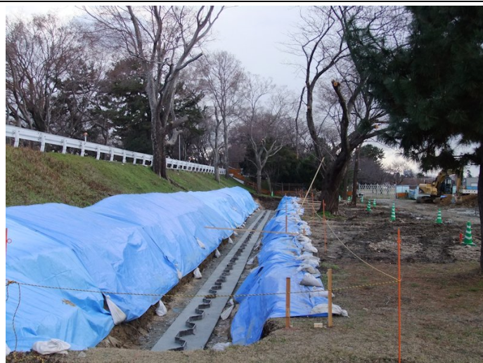
⑥南武庫之荘で矢板打ちが終わり傘コン工事も終盤