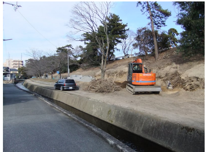
⑩樋ノ口町のドレーン工法工事現場。