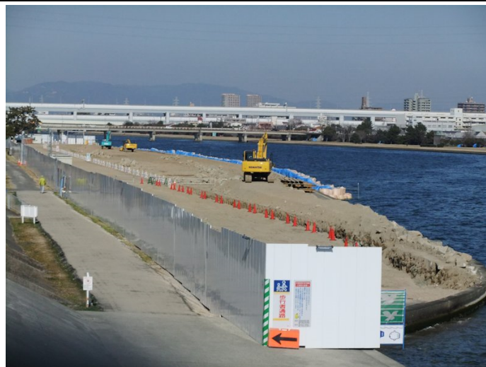
②土嚢積み以降工事が止まったように見える掘削区域。