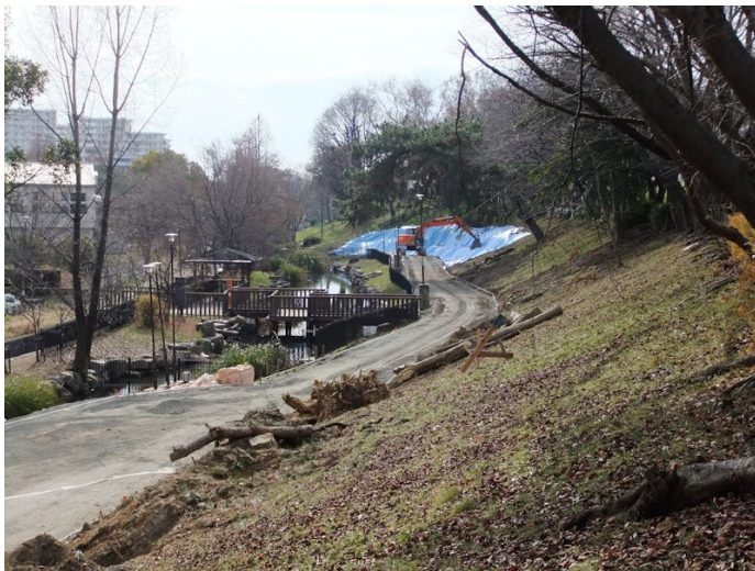
⑨武庫豊町でドレーン工法工事が始まった