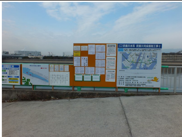
①河口部で第2期浚渫工事が始まった。

堤防の一部が掘削され、堤防の素材が見える。場所によって多少の違いはあるが、堤防の素材は基本的に砂質であるが、がれきや何かの残土を積み上げたような印象を受ける。堤外に気をとられ堤内の工事前も情報を取り損ねた