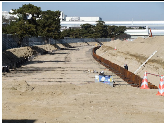
③第2工区矢板打ち区間も一部埋め戻しがはじまった。