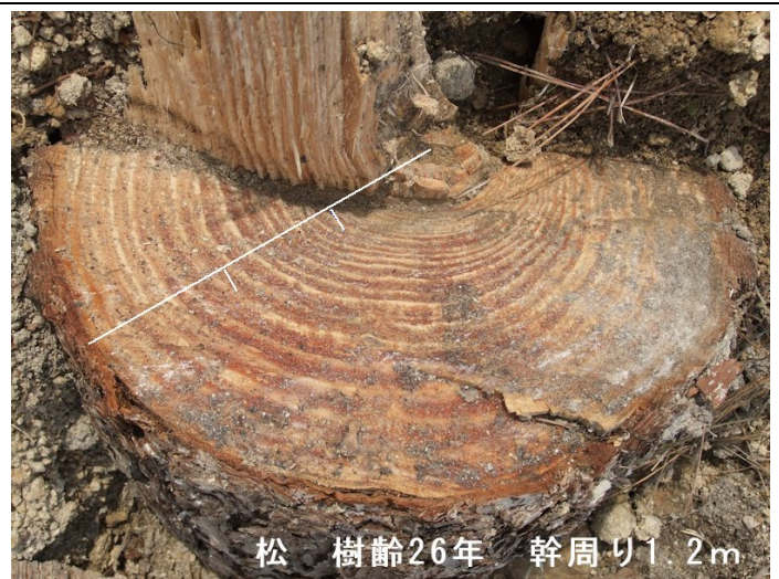
松 樹齢26年 幹周り1.2m