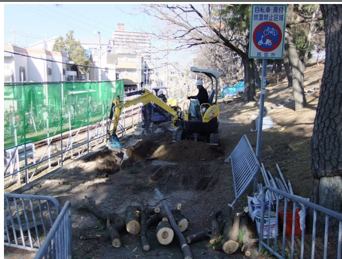
④小松南町のドレーン工法工事が始まる。