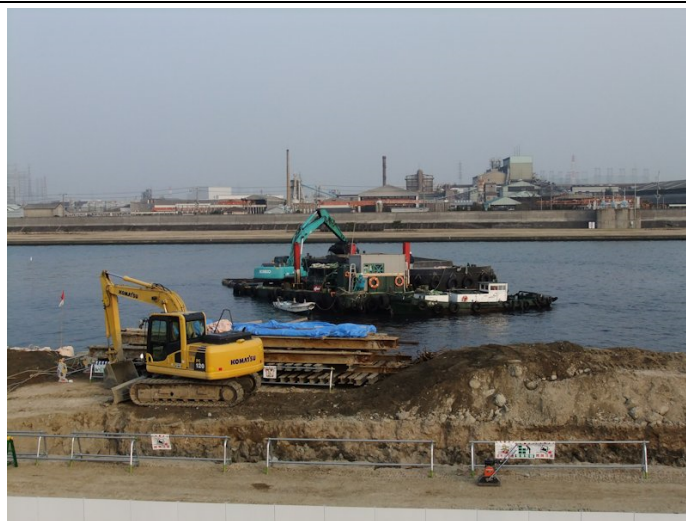
④第1工区前まで進んだ第二次浚渫工事