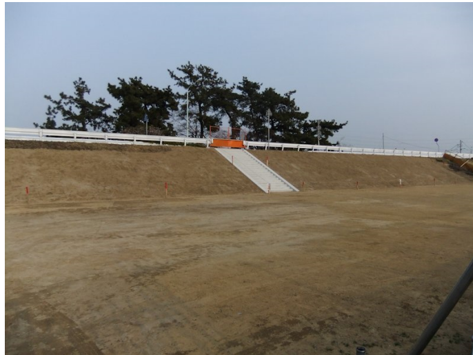
②大庄矢板工事終了芝生養生中