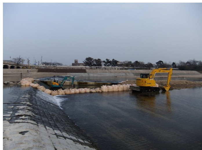
⑤第2堰魚道改修工事