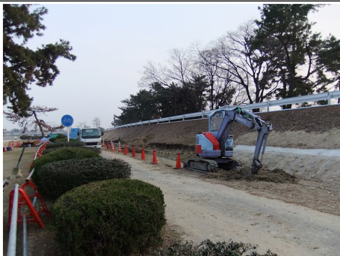
③小松南矢板区間法面ブロック覆い始まる