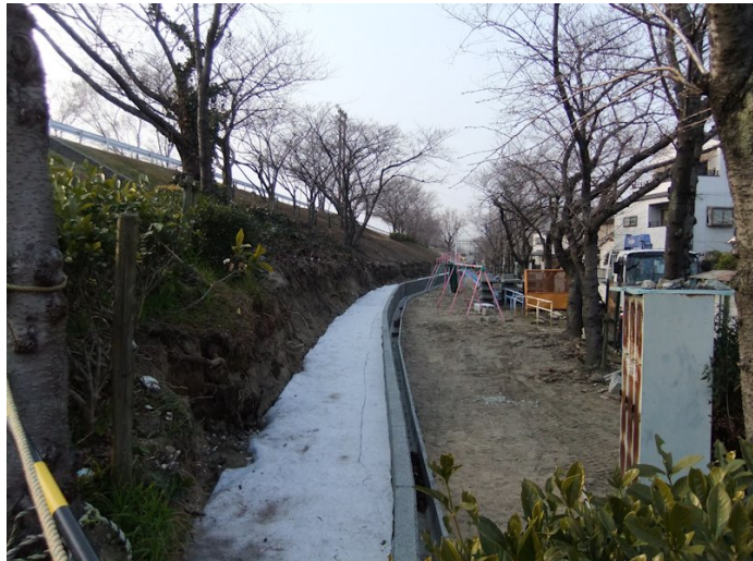
①南武ポンプ場付近のドレーン工法工事