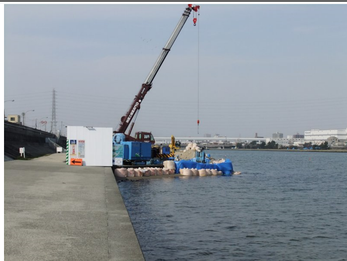
④第1工区先端部矢板打ち工事