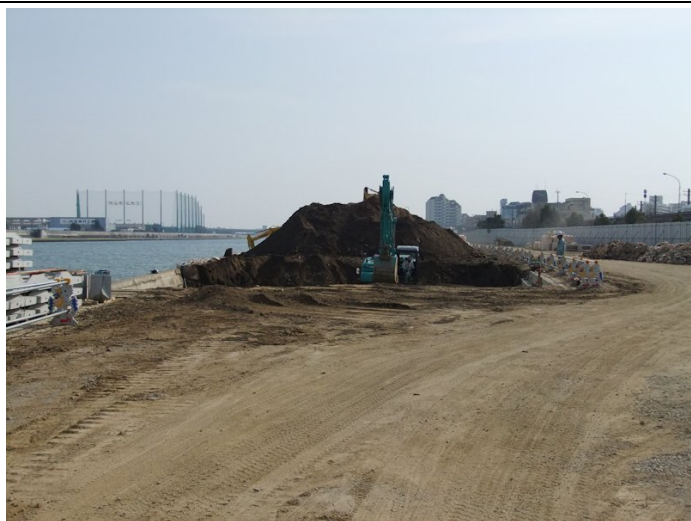
③第1工区上流側で掘削工事が始まった。