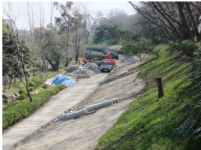
②武庫豊町工区。法面被覆工事を残すのみ。