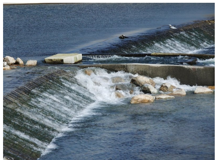
⑤第2堰魚道改修状況、遡上シーズンに遡上観察したい

甲武橋水位観測点整備状況。年1回整備している。殆ど狂いなく年1回の整備で十分とのことだった。