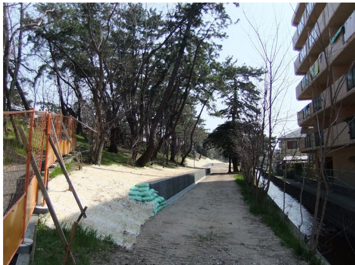
①樋ノ口工区は工事終了法面草の養生中