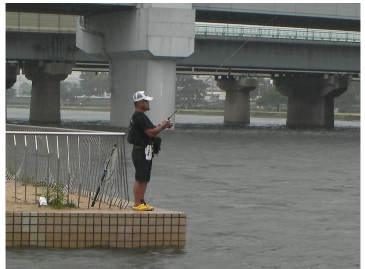
④スズキ狙いの釣り人が堰撤去反対していた。