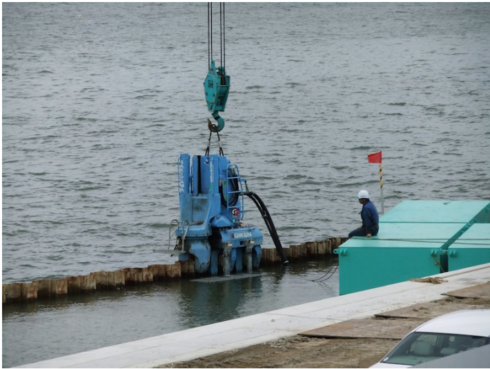
①矢板引き抜きブレイカー (引き抜き能力 100ト)