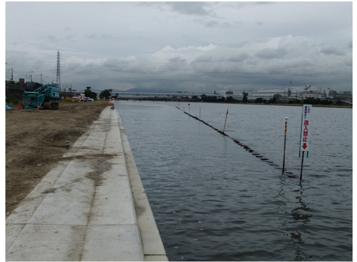
②工事期間終了で残された矢板