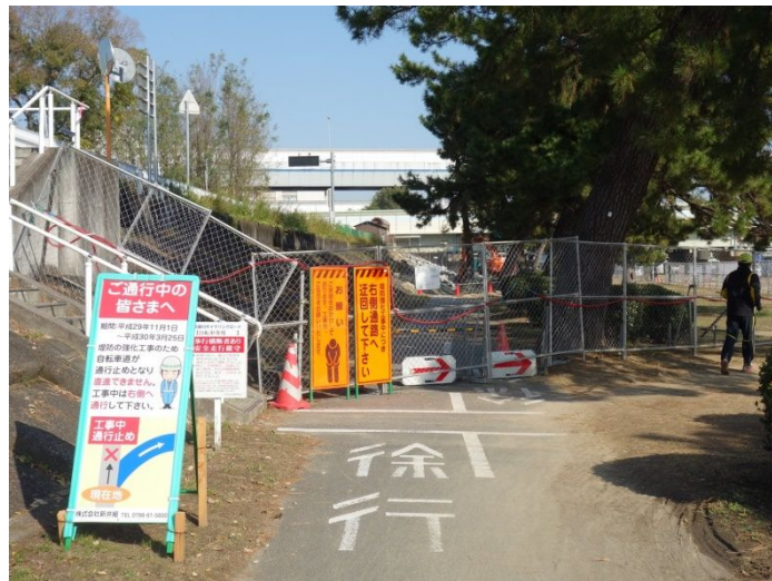
東鳴尾工区堤防強化工事始まる（浸透対策矢板打ち）