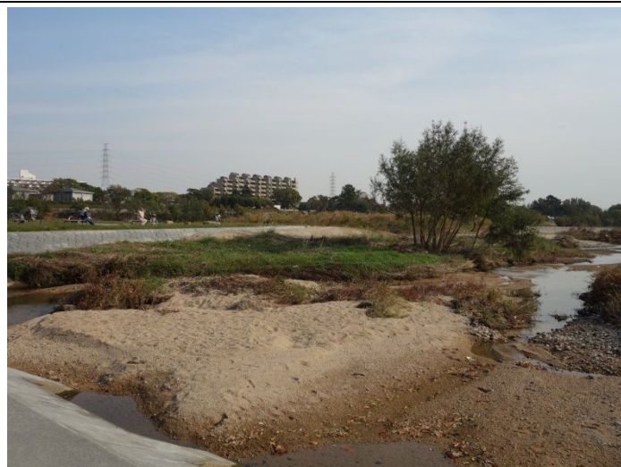
21.25号台風以降の出水で土砂堆積が進んだ仁川合流点