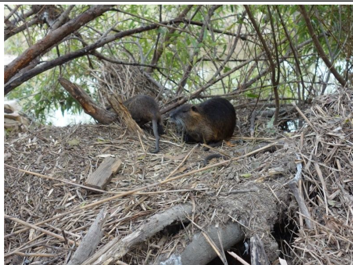
水制工上の柳に引っ掛ったヨシ屑がヌートリアのベットに