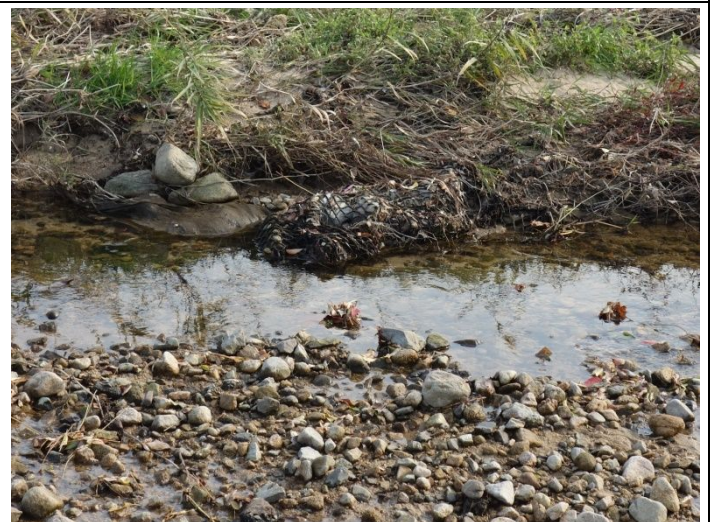
頑張って作った隠れ家も流れが変わり水面上に顔出した。