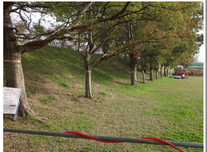
尼崎東工区堤防強化工事（伐採予定のアキニレ）