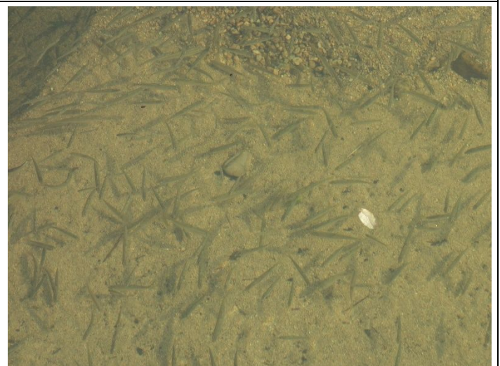
出水で川底の汚れが流され小魚が集まった仁川合流点

河川工事期間に入り各所で河川改修工事（29年度工事箇所）が始まった。主たる工事は堤防強化工事で具体的には矢板打ち工事である。南部橋架け替え工事仮設橋建設が始まり武庫川下流部の阪神橋梁付近と南部橋付近の問題箇所の改修工事と右岸の浸透対策工事と相まって潮止堰撤去工事推進環境が整ってきたようである。