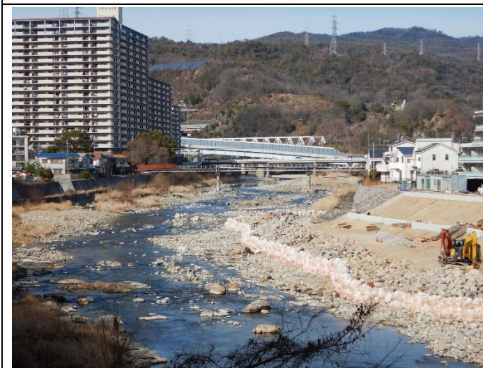
河原の巨礫を貼り付けて堤防改修 2022年2月9日