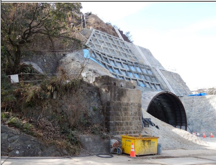
城山トンネル貫通 2022年2月9日