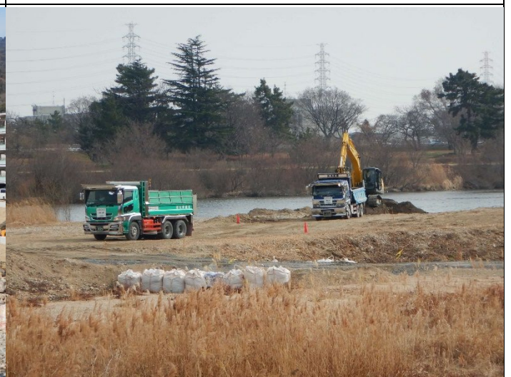
仁川合流点掘削工事始まる 2022年2月15日

武庫川本流・支流の各所で堆積土砂掘削が行われている。波豆川ではコンクリートブロック張り護岸の経年劣化？復旧工事が行われ、多分傷んでいない左岸と同じ仕様で復旧されるものと思う。部分的な工事では前後との取り合いから考えれば妥当な施工方法だろう。