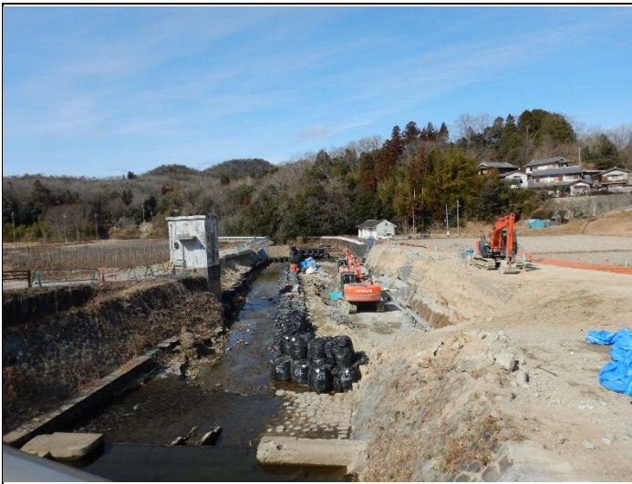
波豆川護岸改修工事 2022年2月9日