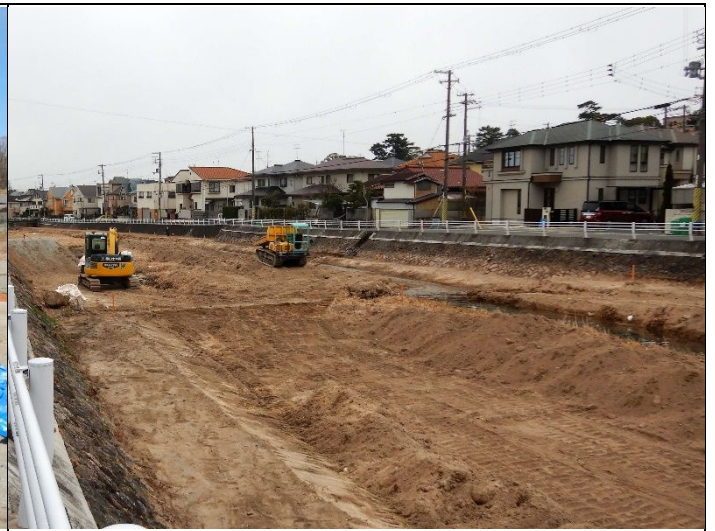
仁川土砂掘削工事 2022年2月13日